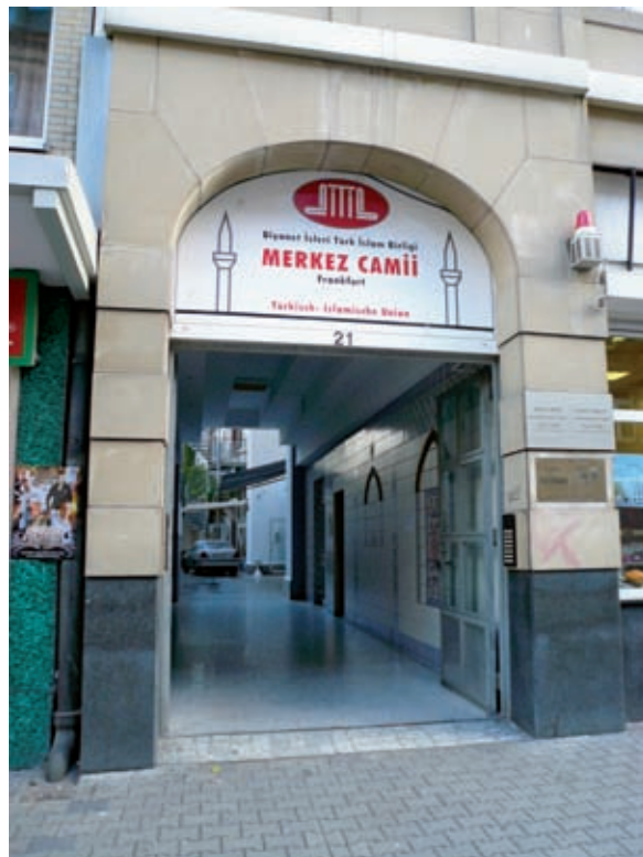
Hinterhofmoschee: Eingang zu einer Frankfurter Moschee in der Münchner Straße – immer noch gibt es zahlreiche muslimische Gemeinden in Deutschland, die den schon vorhandenen Gebäudekomplex als Moschee nutzen. Doch der Wunsch, ein eigenes Gebetshaus zu errichten, wächst bei vielen islamischen Migranten.

Inzwischen sind in Deutschland die Moscheeneubauten kaum mehr zu zählen, nicht selten wird nicht unterschieden, ob das Gebäude von einem religiösen und / oder einem ethnisch-kulturellen Verein gebaut oder genutzt wird. Daten sind über die Homepages der großen Dachverbände zu erhalten, wobei auch zu berücksichtigen ist, dass sich viele Muslime und ihre Vereine keinem dieser Verbände zuordnen. Generell ha-