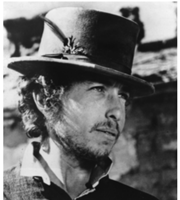
Szene aus »Pat Garrett & Billy the Kid«: Ursprünglich sollte Dylan nur eine Reihe von Songs für den Sam Peckinpah-Film schreiben, doch dann übernahm er auch die Nebenrolle des rätselhaften Alias – Mitglied in Billy's Band aus Gesetzlosen. Mit »Knockin' On Heaven's Door« enthält der Film einen der bis heute größten Dylan-Hits.

siert, obwohl sein gegenüber Benjamin vorgetragener Ansatz sie enthält und zulässt. Der Dialektik des Obersten sollte aber wohl auch die des Untersten adäquat sein. In diesem Sinne eines veränderten Autonomiebegriffs gewinnt die Musik Dylans als ein von der Kulturindustrie ausgehendes Produkt eine beson-