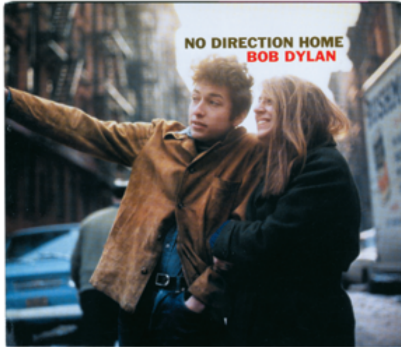
»No Direction Home«: Die Doppel-CD, hier das Cover des Booklets, enthält seltene und unveröffentlichte Aufnahmen Dylans aus den Jahre 1961 bis 1966, die während der Dreharbeiten zu Martin Scorseses Film entdeckt wurden.

Mit »ästhetischer Autonomie« verbinden wir heute mehr oder minder feste Vorstellungen über die Eigenarten eines künstlerischen Werks: der schriftlichen Repräsentanz, der klaren Differenz von Komposition und Interpretation, ein sich eher ausschließendes Verhältnis von ästhetischer Qualität und sozialer Wirkung. Dass all dies für Dylan zumindest nicht direkt zutrifft, liegt auf der Hand, verdankt sich seine Musik doch, wie Rock- und Popmusik überhaupt, primär mündlichen Traditionen auf der einen Seite und der modernen Reproduktionstechnik auf der anderen. So ist sie von vornherein ein Element